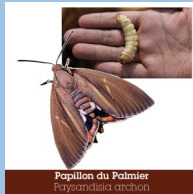
Papillon du Palmier Papilio archon

En luttant vous évitez que vos palmiers dépérissent.